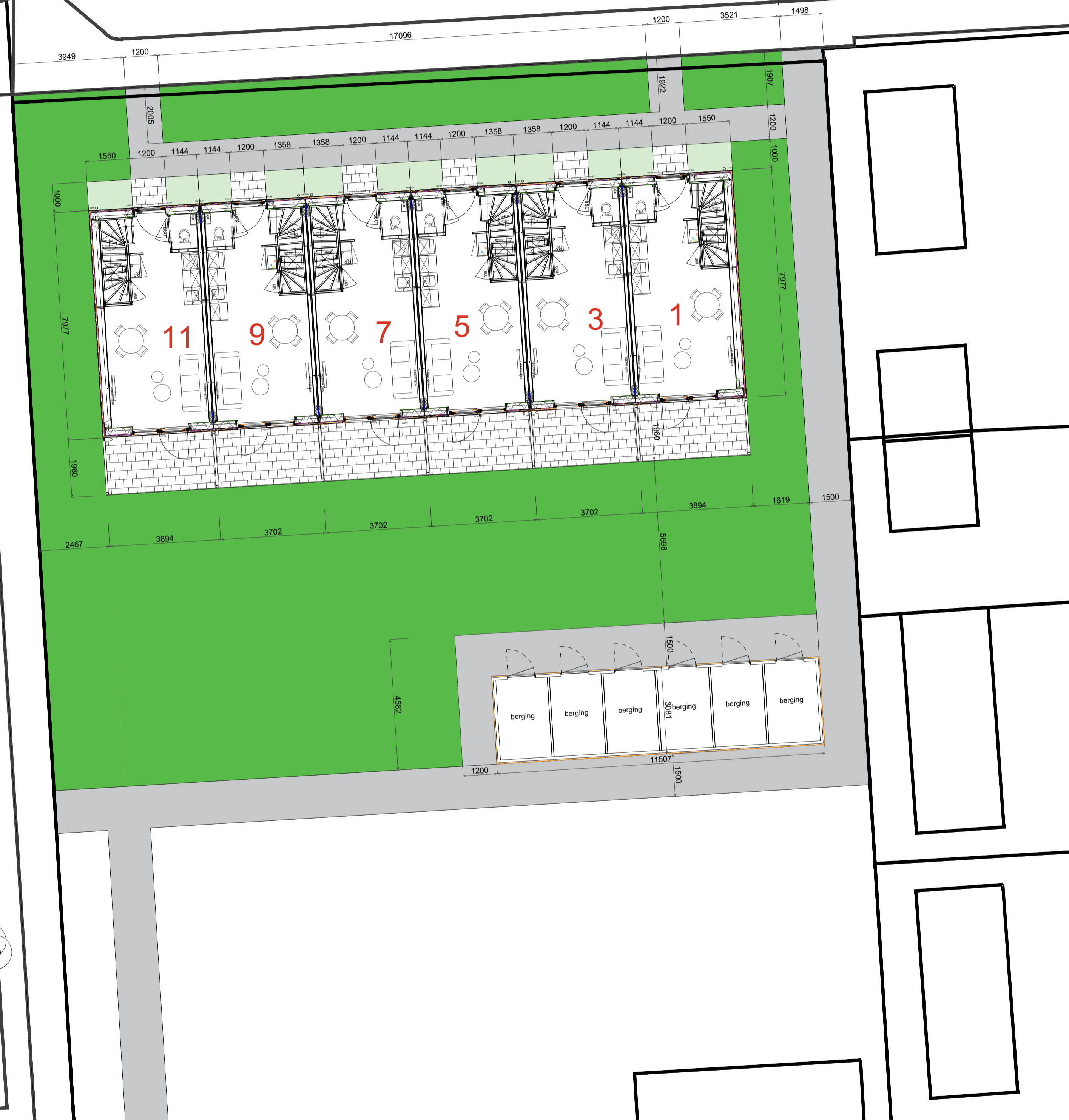
Terreinrichting - schaal 1:100